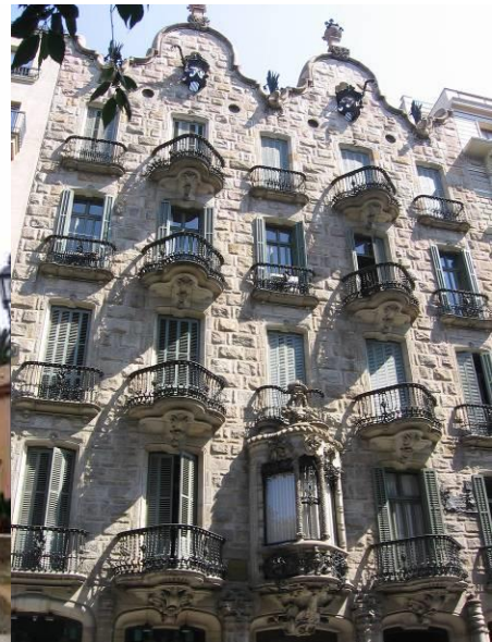
Рис. 7. Будинок Кальвет

Винні погребки Гуеля – архітектурний комплекс в Сіджесе, Барселона. Комплекс складається з двох будівель: вхідного приміщення і льохи, що зведений з місцевого гаррафського каменю і має пірамідальну форму, об'єднує дах і стіни. Будова має три рівні. Перший рівень – гараж і льох, другий – житловий, третій – домашня церква та оглядовий майданчик. (рис. 6).