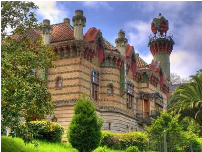
Рис. 3. Ель-Капричо