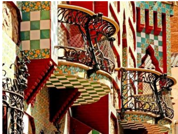
Рис. 2. Будинок Вісенс, приклад керамічної плитки

Гауді ненавидів замкнуті і геометрично правильні простори, уникав прямих ліній, вважаючи, що пряма лінія – це породження