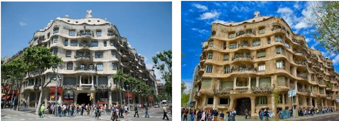
Рисунок 10 Каса-Міла

Каса-Міла – житловий будинок, побудований в 1906-1910 роках в Барселоні для сім'ї Міла, остання світська робота Гауді (рис. 10).