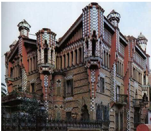
Рис. 1. Будинок Вісенс

Традиційно Гауді зараховують до каталонському модерну, але повністю він не вписується ні в яку архітектурну течію. Його можна віднести до мавританського бароко, до неокласицизму або до неоготики. Але він «перемішав» всі архітектурні стилі, створивши свою власну еkleктику.