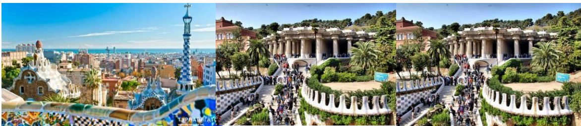
Рис. 8. Парк Гуель

Роботи зі створення парку були розпочаті в 1901 році і велися в три етапи. На першому було виконано зміцнення і облаштування схилів пагорба «Лиса гора», розташованого в «верхній», ближньої до гір, частини Барселони. На другому етапі були прокладені внутрішні під'їзні дороги, побудовані вхідні павільйони і навколишні територію стіни. Для дозвілля та зборів майбутніх мешканців була створена колонада ринку з верхньої центральної еспланадою і зведений зразок житлового будинку для показу майбутнім покупцям.