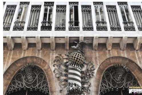
Рис. 5. Палац Гуель

Зовні будівля облицьована рядами цегли і керамічної плитки. Головний фасад підкреслено виділений в цоколі пофарбованої в охристі і сірі кольори рустикою з грубим рельєфом. Перший поверх облицьований широкими рядами різнокольорових цеглин, що чергуються з вузькими смугами майолікових плиток з рельєфними зліпками сучків соняшнику.