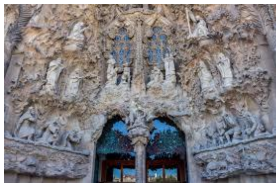
Рисунок 11. Собор Святого Сімейства. Оздоблення

Башти Собору трималися на цегляних арках всупереч всім відомим в той час законам опору матеріалів. Лише через сто п'ятдесят років вчені змогли вивести математичну формулу його знаменитих архітектурних парабол і гіпербол.