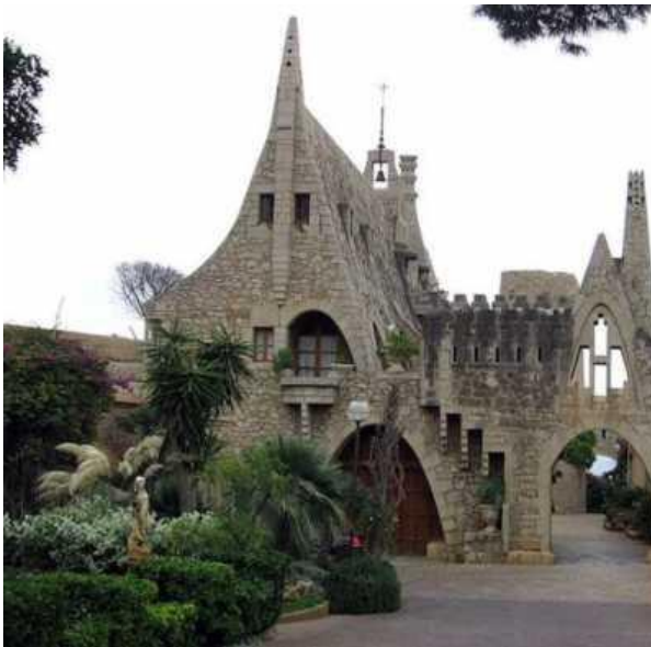
Рис. 6. Винні погребки Гуеля

У 1984 році палац Гуель разом з іншими архітектурними шедеврами Гауді був внесений до Списку Всесвітньої спадщини ЮНЕСКО.